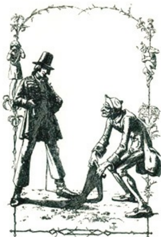
Peter Schlemihl vend son âme au Diable