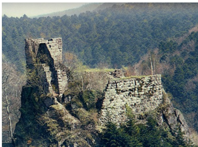
Le Nideck. Château supérieur