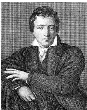
Heinrich Heine d'après un tableau de Moritz Daniel Oppenheim

Ranicki ( http://www.bibliotrutt.eu/artman2/publish/notes/Marcel_Reich-Ranicki_77.php ) au tome 5 de mon Voyage ). Une remarque encore, amusante, à propos de sa langue et rapportée par Reich-Ranicki, souvenir de ses années d'étudiant dans le Berlin hitlérien : un prof nazi qui dit : voyez dans la Lorelei, comme il est influencé par le yiddish quand il écrit : Ich weiss nicht was soll es bedeuten, alors qu'en allemand correct on doit dire : Ich weiss nicht was es bedeuten soll ! Et Reich-Ranicki cite encore Nietzsche qui écrit dans Ecce Homo : « C'est Heinrich Heine qui m'a donné la plus haute idée de ce qu'est un poète lyrique. Je cherche vainement ailleurs dans toutes les régions et tous les âges une musique à la fois si douce et si passionnée. Il possédait cette méchanceté divine sans laquelle je ne puis me représenter la perfection... Et comme il manie l'allemand! ».