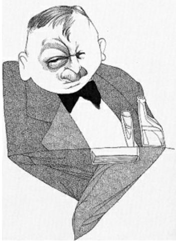
Joseph Roth par Loredano (collection Reich-Ranicki)

remarquable trilogie des films d'Alex Corti, intitulée Bienvenue à Vienne , sortie en 1987 et dont le premier film, Dieu ne croit plus en nous , montre comment celui dont le film est l'autobiographie romancée, le scénariste Georg Troller, a failli être carrément livré aux Nazis). Exilé finalement aux Etats-Unis, Feuchtwanger n'a pas eu de change non plus : il est soupçonné de communisme dans le contexte MacCarthy et ne peut obtenir la nationalité américaine. Mais il y reste et y meurt.