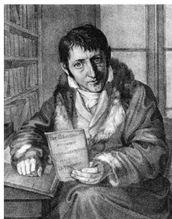
Ludwig Börne d'après un tableau perdu de Moritz Daniel Oppenheim (Collection Reich-Ranicki)